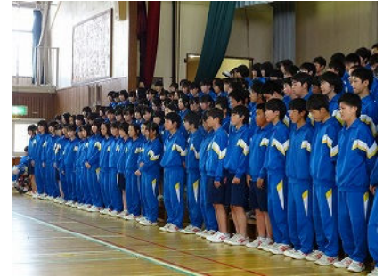
<新入生歓迎会 3年合唱>

新年度がスタートして約1ヶ月が経ちました。生徒達は、新たな目標に向かって、先生と毎日色々な事に取り組んでいます。4月の行事の中でも全校生徒が一堂に会する行事では、生徒と教師全員が一丸となって取り組みました。特に新入生歓迎会の姿は、どの学年も本当に立派で、今後の三中が楽しみだと感じる事ができました。3年生は、リーダーとして部活動や委員会活動を通して成長し下級生をどんどんリードする存在になることを、2年生は、新学級での林間学校に向けての取り組みを通して、新たな自分、新たな友達に良さをを見つけることを、そして、1年生は、授業や委員会、部活動も本格的に始まり疲れが出てくるかもしれません。中学校生活にまずは「慣れる」ということを、心掛けてください。